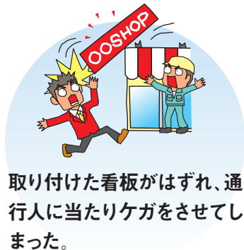
取り付けた看板がはずれ、通行人に当たりケガをさせてしまった。

貴社が行った仕事を終了した後、その仕事の欠陥により発生した偶然な事故により、他人の生命や身体を害したり、他人の財物を滅失、破損または汚損した場合に、貴社が法律上の損害賠償責任を負担することにより被る損害に対して、保険金をお支払いします。