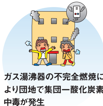
ガス湯沸器の不完全燃焼により団地で集団一酸化炭素中毒が発生