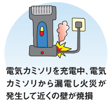
電気カミソリを充電中、電気カミソリから漏電し火災が発生して近くの壁が焼損 など