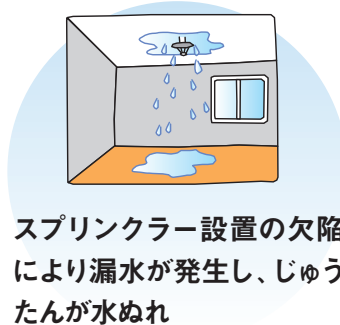
スプリンクラー設置の欠陥により漏水が発生し、じゅうたんが水ぬれ