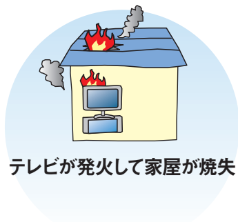
テレビが発火して家屋が焼失

貴社が製造・販売した財物(生産物)が他人に引き渡された後、その生産物の欠陥により発生した偶然な事故により、他人の生命や身体を害したり、他人の財物を滅失、破損または汚損した場合に、貴社が法律上の損害賠償責任を負担することによって被る損害に対して、保険金をお支払いします。